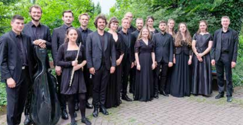
Am 25. September ist das Vokalwerk Hannover in der Marktkirche zu Gast