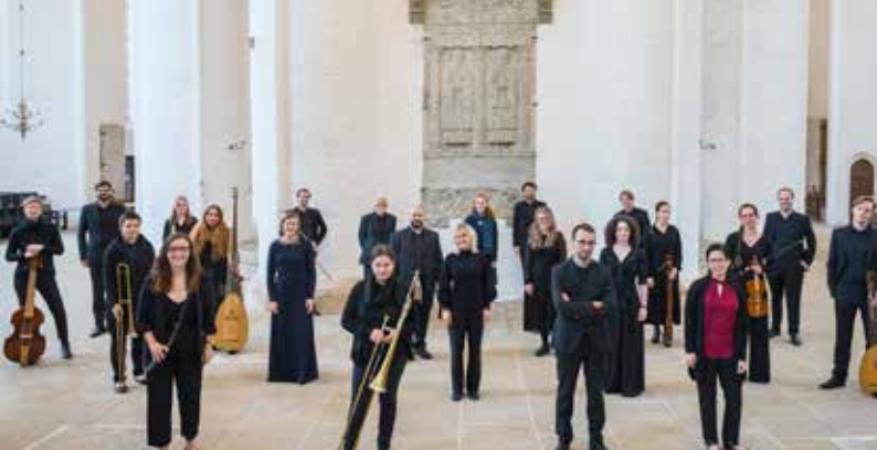
Festmusik der Hansestädte mit dem Europäischem Hanse-Ensemble