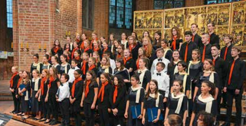
Am 18. und 19. September: Kindermusical mit dem Kinder- und Jugendchor

Sa, 4. September Orgelkonzert 18 Uhr Marktkirche Werke von Karg-Elert, Tournemire, West Felix Mende (Bremen) Eintritt: 6,- Euro | erm. 4,- Euro