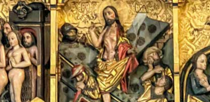
Triduum, die heiligen drei Tage, sind ein einziger Gottesdienst.