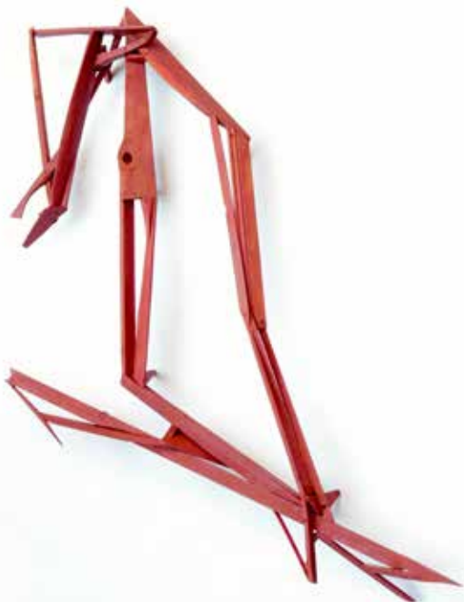
Zurückgelegter Weg (2018, Holz, Farbe, 242 x 175 x 28 cm) von Pomona Zipser