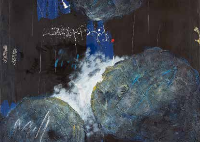
„Unser Retter der Tod“ von Uwe Appold