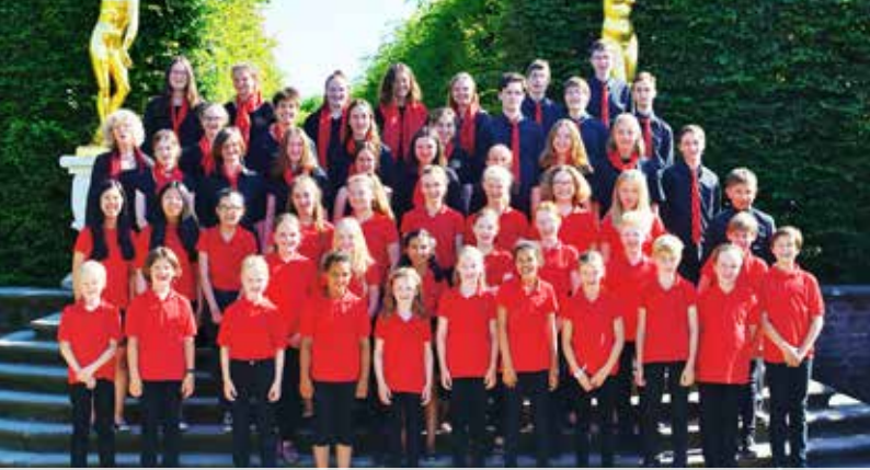
Noch am Boden: der Kinder- und Jugendchor der Marktkirche