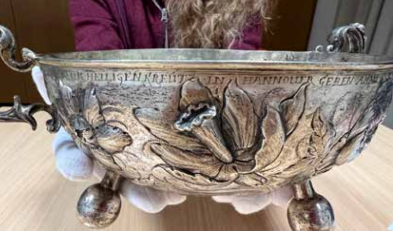
Die Taufschale ist eine Stiftung aus dem Jahre 1664 an die Kreuzkirche.