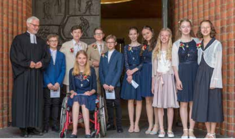
Der erste Konfirmand*innen-Jahrgang in der Marktkirche nach langer Pause.