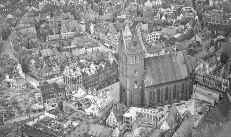
Die Marktkirche im Juli 1943 nach dem ersten Luftangriff auf die Altstadt.