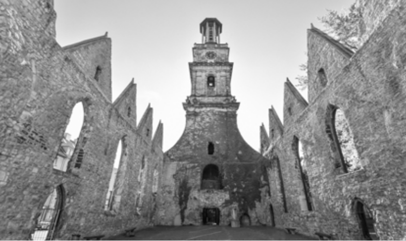
Die Ruine der Aegidienkirche blieb als Kirche des Friedenswunsches unverändert.

heute an diesen Tag erinnern. Das Kirchenschiff mit der Orgel blieb jedoch – noch – durch einen Einsatz der Feuerwehr weitgehend unbeschädigt.